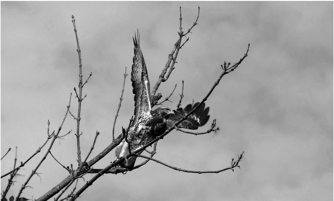
Mäusebussard Foto: Cristina Krippahl, 2018

Baumhasel, Eingrifflicher Weißdorn, Vogel-Kirsche, Stein-Weichsel, Amerikanische Rot-Eiche, Trauben-Eiche, Europäische Eibe und Flatter-Ulme.