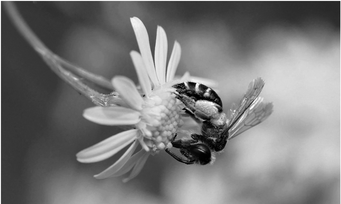
Furchenbiene auf Greiskraut

und eine Verringerung der Biodiversität zur Folge hat. Sie ist aus naturschutzfachlicher Sicht eindeutig abzulehnen und widerspricht umsichtigen Planungen für eine Stadt, die den Folgen des Klimawandels standzuhalten vermag.